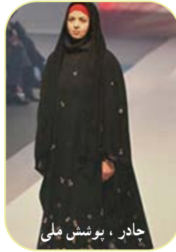
چادر، پوشش ملی