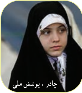
چادر، پوشش ملی