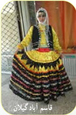
قاسم آباد گیلان