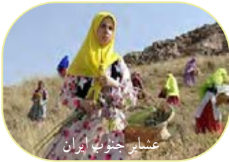
عشایر جنوب ایران